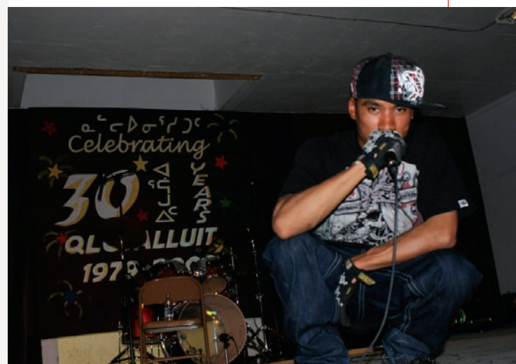
> Young Black Inuk ( www.bebo.com )