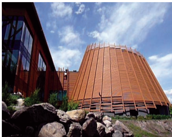
> Hôtel-Musée Premières Nations à Wendake.

En 2008, les Wendat de Wendake, forts du statut de Première nation hôtesse, et des budgets allant avec lui, lors des festivités du 400 e de Québec, 1608-2008, se dotent de l'originale infrastructure d'un hôtel-musée ainsi que d'une scène extérieure, s'ajoutant au pow-wow réactivé depuis près d'une décennie.