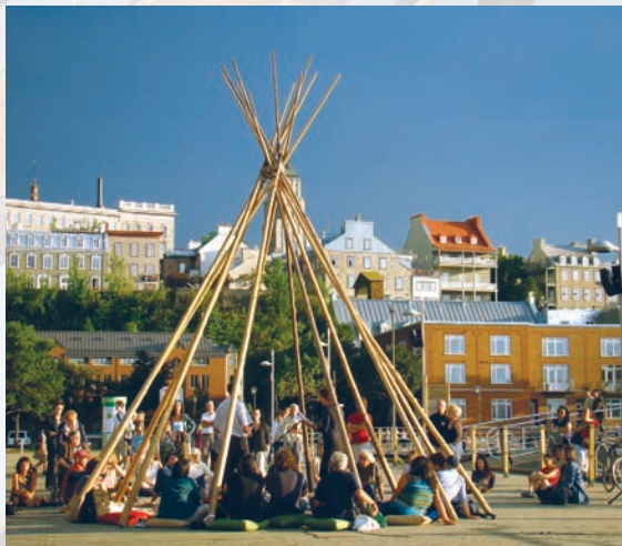
> Shaputuan, Espace 400 e , Québec, 2008.