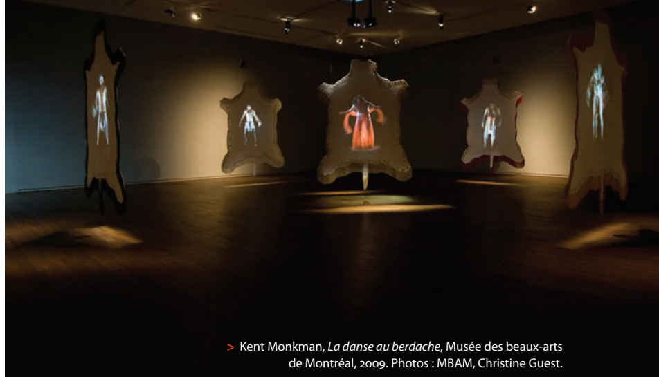
> Kent Monkman, La danse au berdache , Musée des beaux-arts de Montréal, 2009.

L'installation vidéo La danse au berdache , de Kent Monkman, est demeurée visible au Musée des beaux-arts de Montréal de juin à octobre 2009. L'adéquation contexte-contenant-contenu de l'œuvre m'a paru bien refléter la teneur des questionnements que les thématiques et les œuvres d'Indian Art des expositions en milieu canadien et états-unien témoignent. Je fais plus précisément référence à la controversée exposition Remix : New Modernities in a Post-Indian World présentée cet été à la Art Gallery of Ontario (AGO) de Toronto, après son passage à Phoenix et à New York aux États-Unis, une exposition où, incidemment, l'artiste métis torontois était participant.