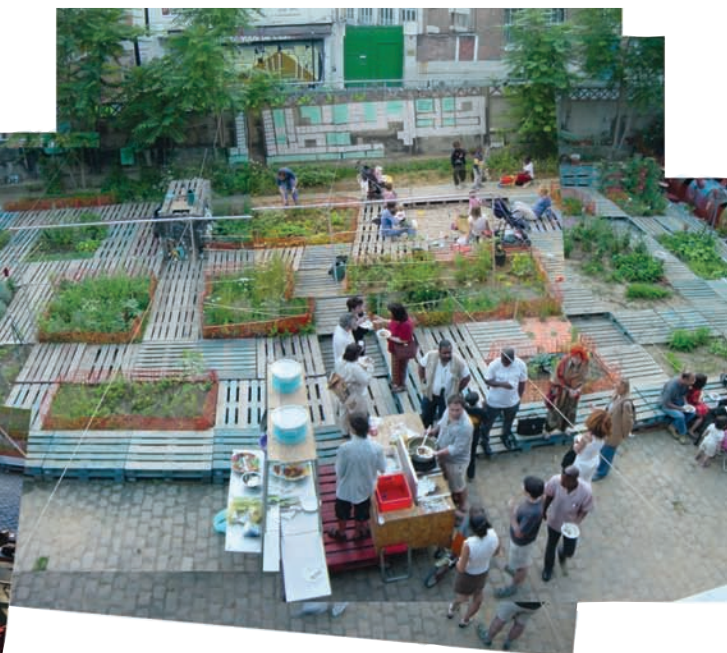
ECObox, Paris 18 e , quartier La Chapelle, site de la Halle Pajol, 2001-2005.