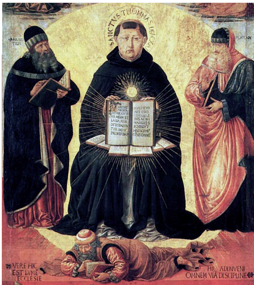
Saint Thomas d'Aquin entre Aristote et Platon et, prosterné à leurs pieds, Averroès, ce qui tend à démontrer que le théologien chrétien s'est inspiré du philosophe arabe, pour ensuite le répudier.