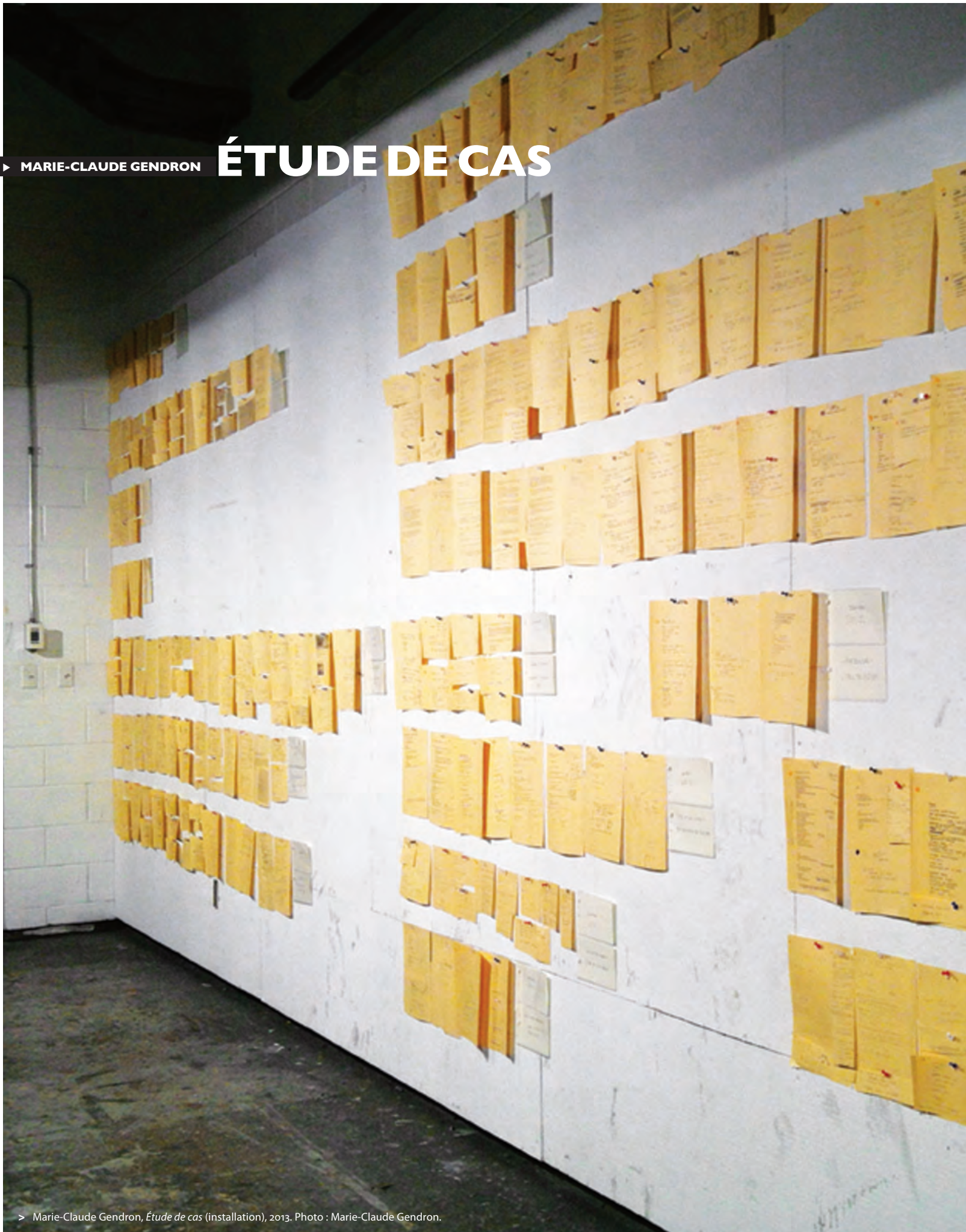
> Marie-Claude Gendron, Étude de cas (installation), 2013.