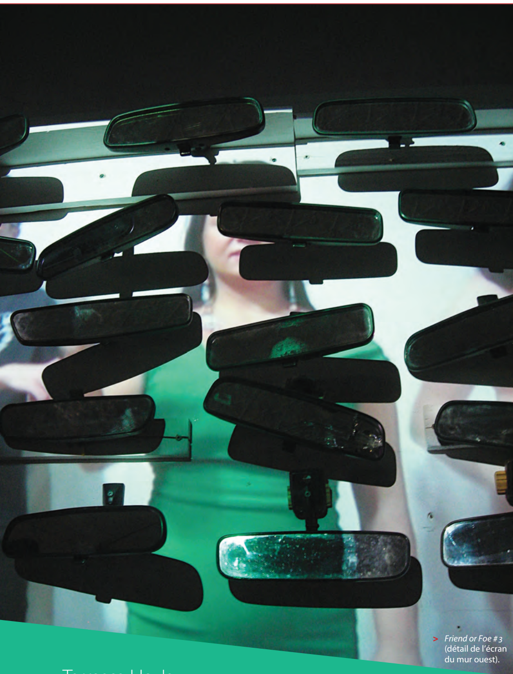
► Friend or Foe #3 (détail de l'écran du mur ouest).