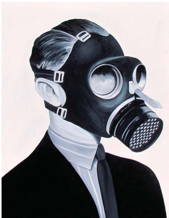
> Raphaël Benedict, Respire... rêve , huile sur toile, 90 x 129 cm, 2013.

Abîme intérieur et mal de vivre, solitude et déversement du trop-plein intérieur, façonnent le destin des êtes et le dessein des destins dans la scription de l'artiste d'origine amérindienne. Il ne s'agit pas seulement des séquelles de la victimisation et de l'acculturation à l'œuvre entre le