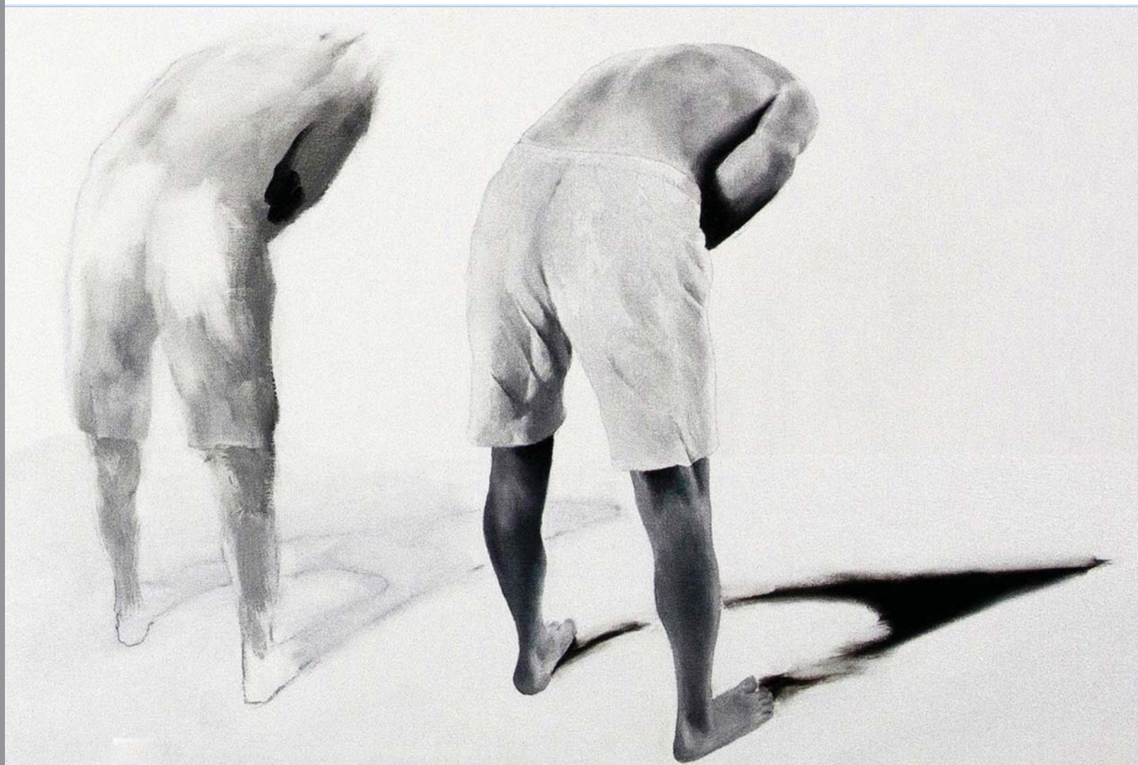
> Raphaël Benedict, Cet état d'être , huile sur toile 140 x 106 cm, 2014.