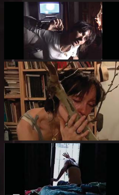
> Opera Epileptic Butoh