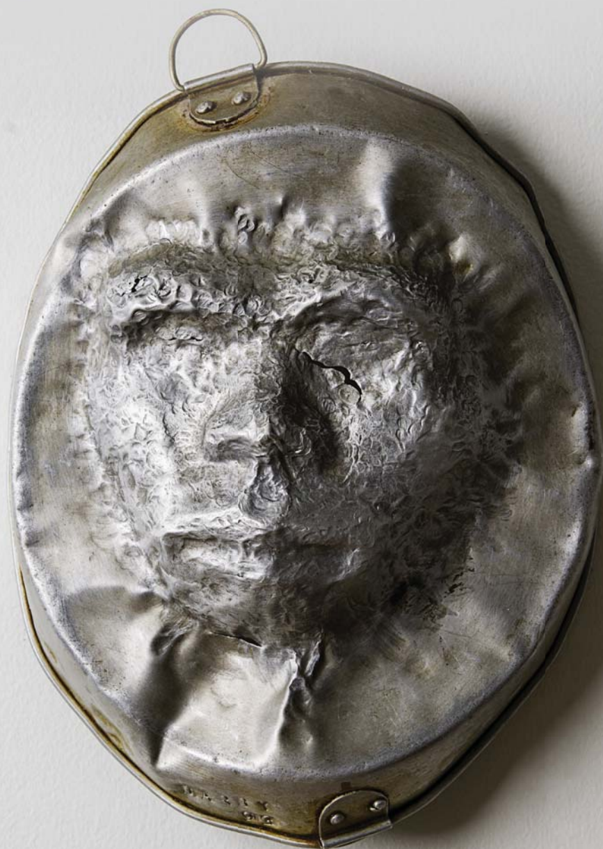
> Femme de Pékin , aluminium, 35,5 x 25,5 x 9 cm, 1993. Collection Jocelyn Gasse.

En 1970, Don Darby obtenait son diplôme de l'École des beaux-arts de Montréal qui fermait ensuite ses portes pour laisser place aux universités. Puis, l'artiste s'est installé à Québec où il a enseigné les arts plastiques plus de 35 ans. Sculpteur, Darby a conçu de nombreuses pièces monumentales et des projets d'intégration d'art à l'architecture à travers le Québec, et ce, jusque dans les années quatre-vingt-dix. On peut voir ses dernières pièces d'art public en bordure de ce qui a été l'îlot Fleurie, ayant hébergé le regroupement communautaire et artistique dans lequel il s'est impliqué activement.