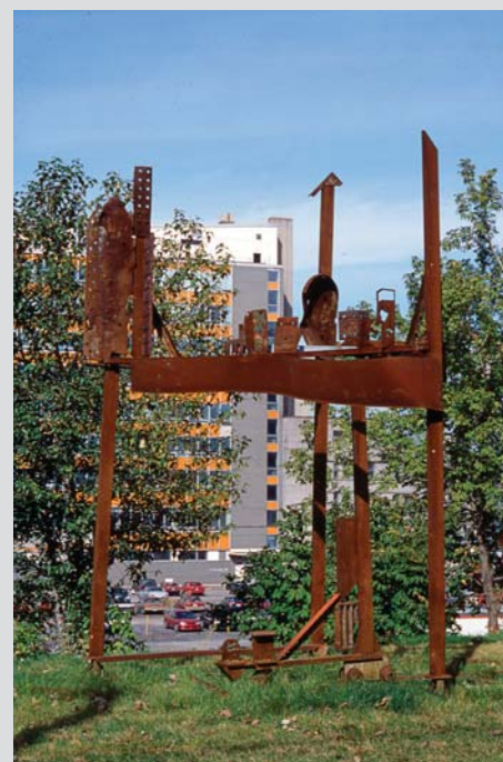
> Thelonious Monk . Acier, 365 x 213.4 x 183 cm, 1993.