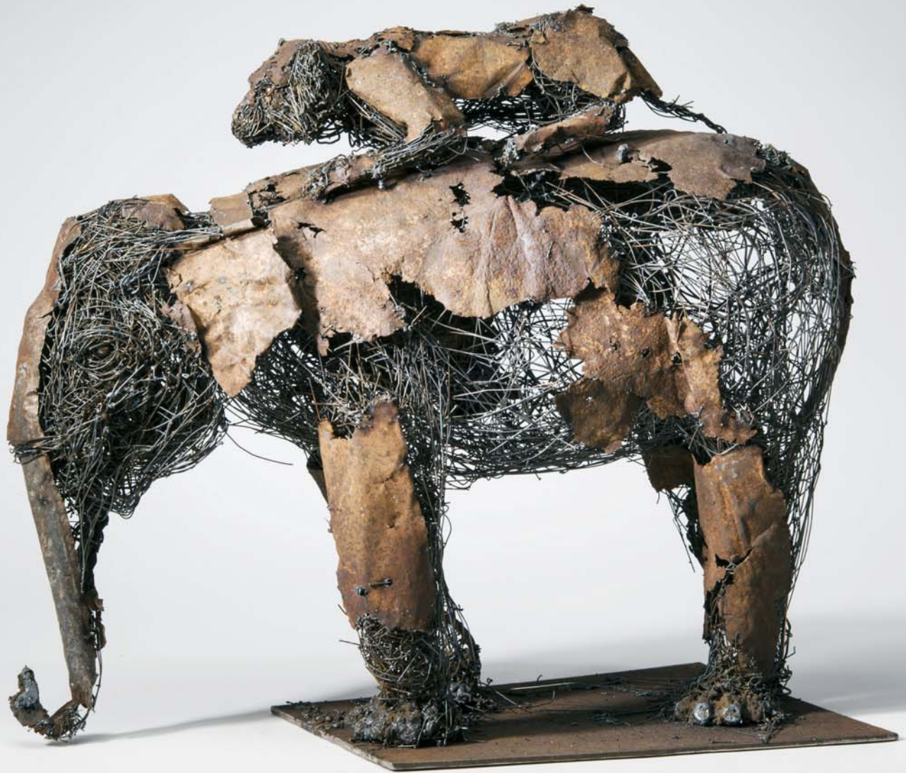
> Éléphant et Tigre , fil d'acier soudé, 57 x 28 x 48 cm, 2014. Galerie Lacerte.