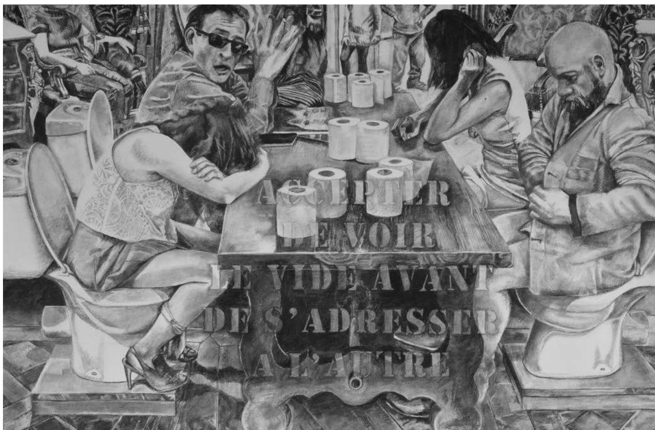
> Éric Madeleine, Entre les lignes (entrebâillements sur une libre interprétation du fantôme de la liberté) , 2015.