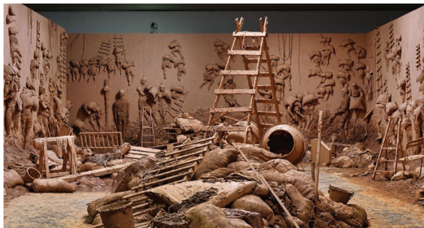
> Vue de l'exposition d'Adel Abdessemed, L'Antidote , Musée d'art contemporain de Lyon, 9 mars au 8 juillet 2018. Œuvre : Shams , 2018.