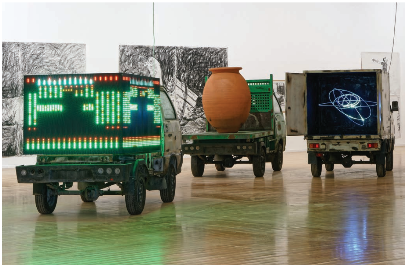
> Vue de l'exposition d'Adel Abdessemed, L'Antidote .

Ainsi en est-il de « Shams », vaste fresque in situ en trois dimensions, disposée à l'étage supérieur du musée, le troisième, et qui en occupe tout l'espace. Cette frise spectaculaire faite d'argile séchée, déjà présentée en 2013 au Mathaf, musée d'art moderne de Doha 2 , l'artiste en ressuscite à Lyon la matière, à l'identique, mais en l'élargissant : cinq mètres de large à l'origine, plus de dix cette fois. Considérable entreprise que celle-ci, faut-il le préciser : l'argile qui fait la matière de