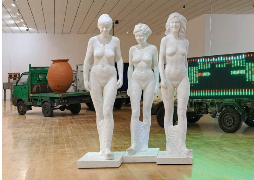
> Vue de l'exposition d'Adel Abdessemed, L'Antidote .

Musée d'art contemporain de Lyon, 9 mars au 8 juillet 2018. © Photos : Blaise Adilon © Adagp, Paris, 2018