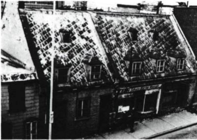
Côte d'Abraham 550 - 564 - 570. Placardée et délabrée