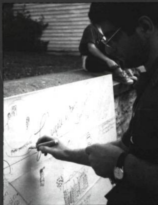
5. Même dans la fête, la question est sérieuse.