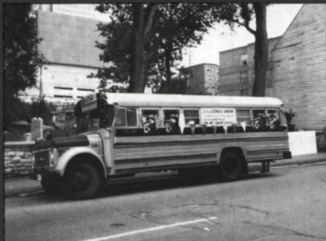
1. L'autobus, un milieu d'information... et le transport en commun?