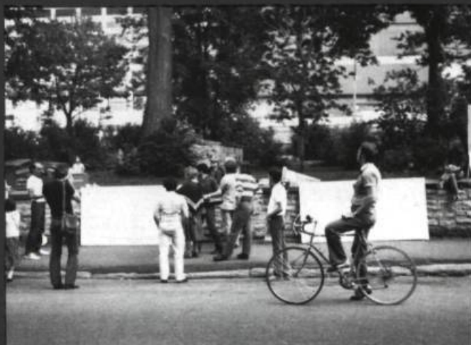
2. La rue... milieu d'échange pour les piétons.