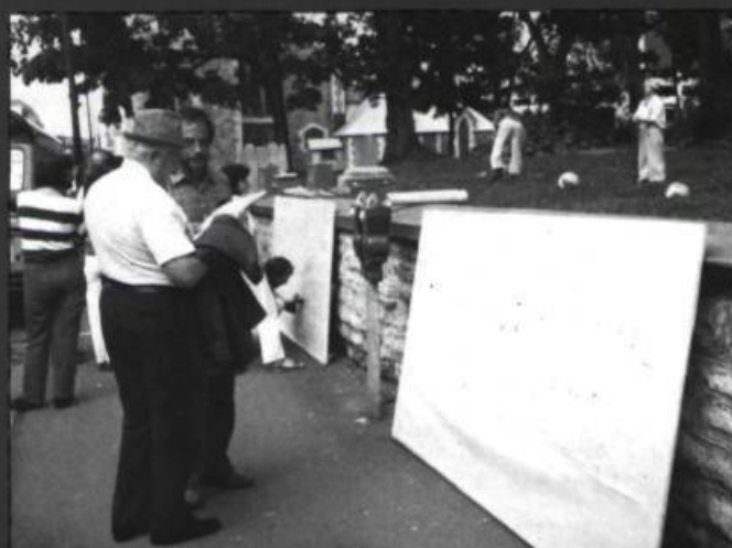
4. La conscience n'a pas d'âge...