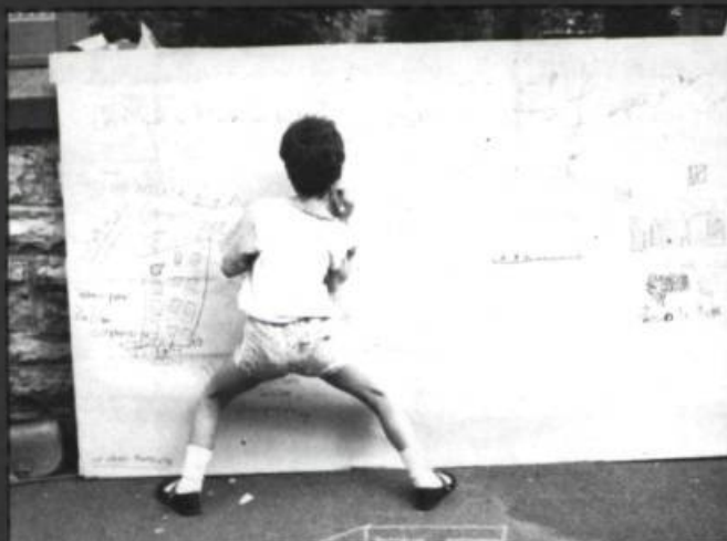
3. Debut d'un engagement... la fin des abus.