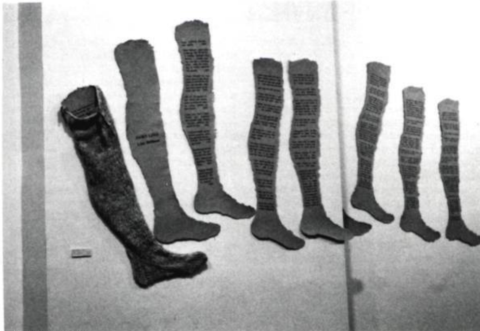
LISE MELHORN: Jambes