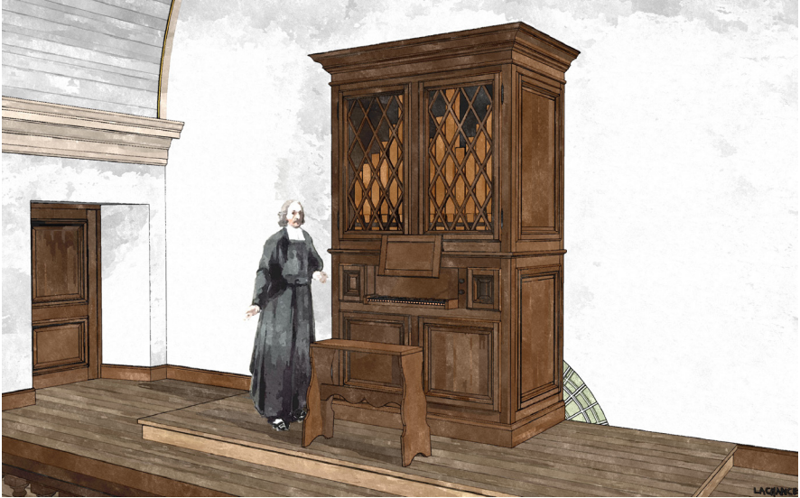
Figure 1. Orgue de bois placé à la tribune de la chapelle du palais épiscopal, ca 1700