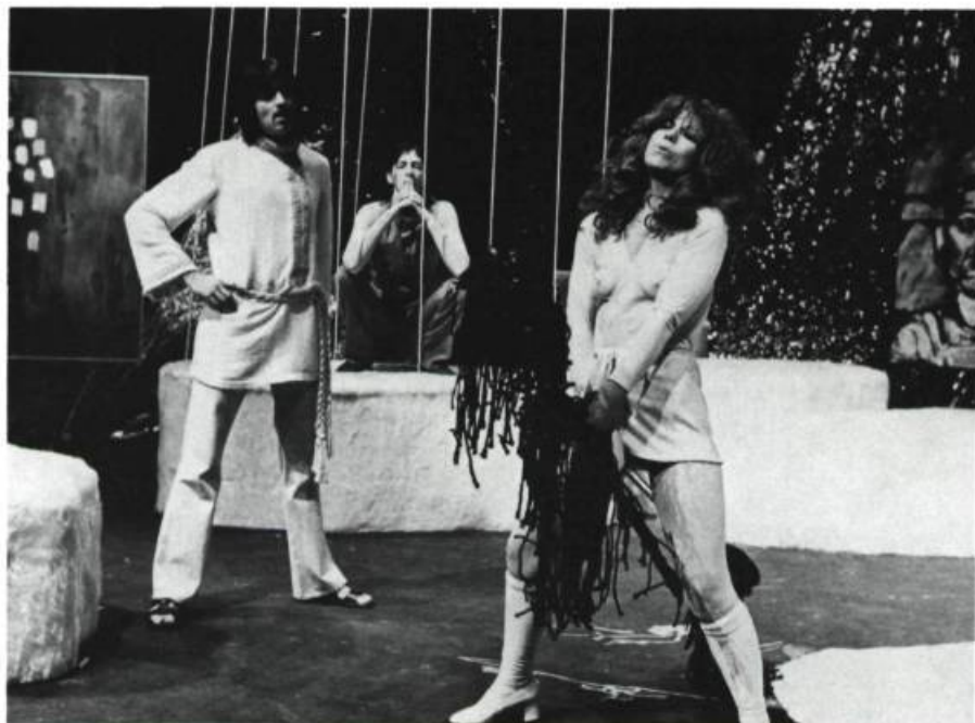
Les oranges sont vertes de Claude Gauvreau, Théâtre Port-Royal, Place des Arts, production du T.N.M.

JEU: Est-ce que vous avez vu, par exemple, le spectacle de la Vraie Fanfare Fuckée au Festival du jeune théâtre à Jonquières, en 1973?