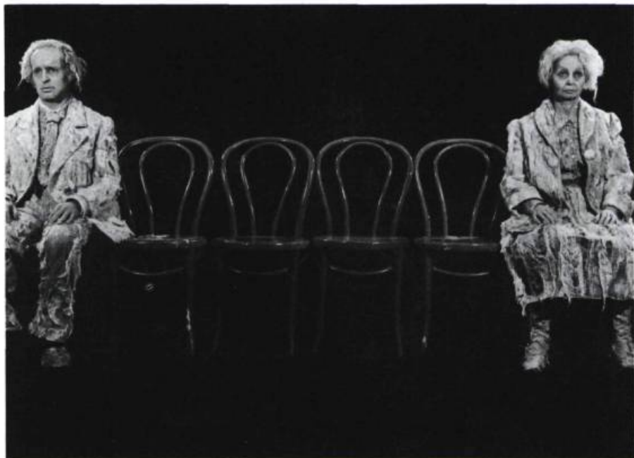
Les chaises de Eugène Ionesco, production du T.N.M.