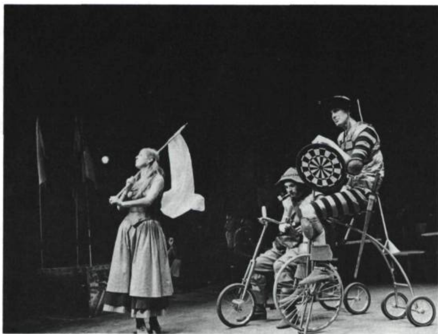
Quichotte , adaptation de Jean-Pierre Ronfard, (en tournée), production des Jeunes Comédiens du T.N.M.

La musique est un art populaire par excellence. Woodstock ou l'Île de Wight sont des phénomènes de rassemblement et des événements. Le cadre est changé. Il faut aller ailleurs que dans les temples de la culture et faire éclater même les cadres physiques de la représentation. Je crois en la possibilité de faire, ailleurs que dans les théâtres, des créations théâtrales importantes. Mais pour que le théâtre devienne véritablement une fête, il faut explorer une mythologie qui puisse être partagée par l'ensemble des spectateurs. Le Bread and Puppet en est une illustration. Le problème du théâtre populaire, c'est qu'il est difficile d'en prévoir le phénomène. Faire quelque chose pour que ça soit po-