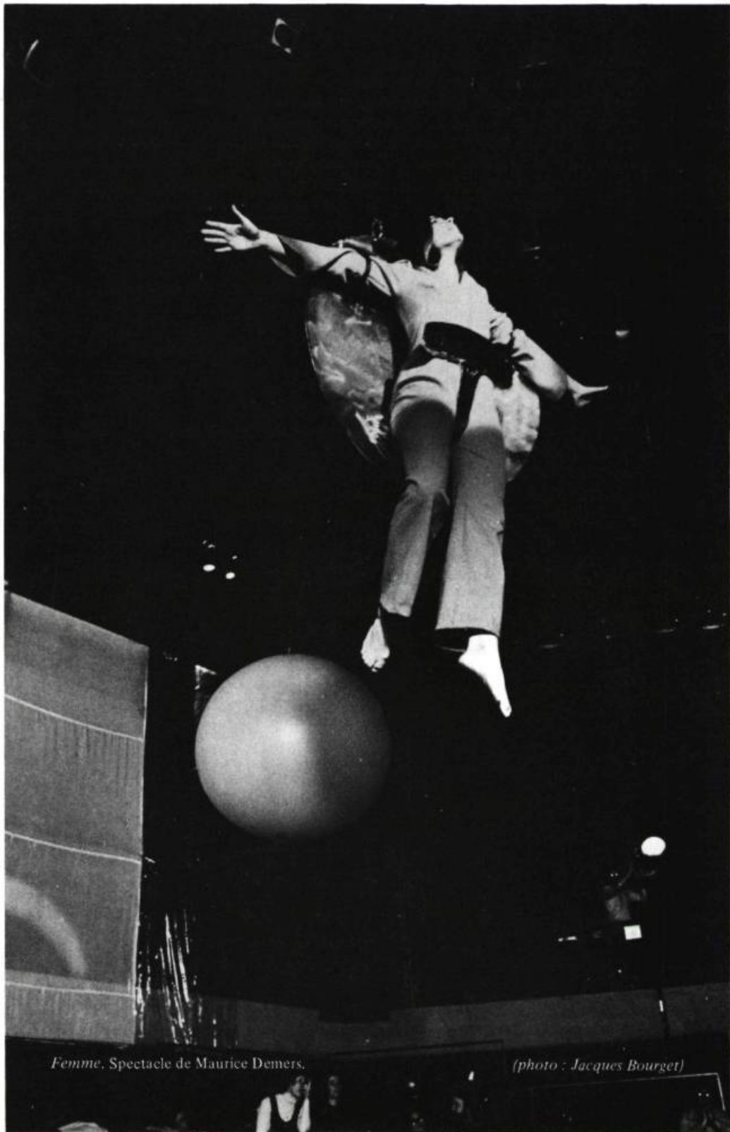
Femme, Spectacle de Maurice Demers.