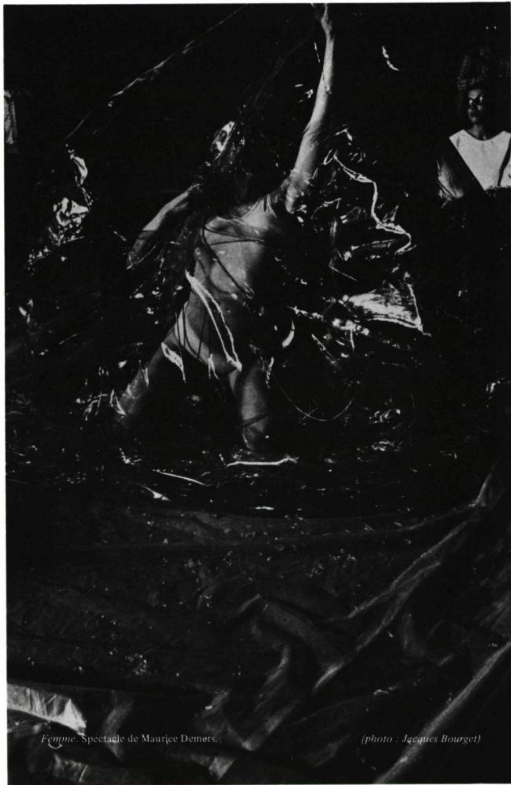
Femme. Spectacle de Mauriçe Demers.