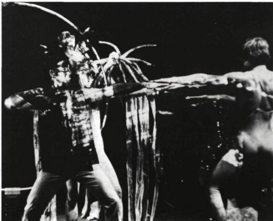
Équation pour un homme actuel de Pierre Moretti. Les Saltimbanques, 1967.