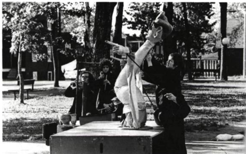
Monsieur Mockinpott. Théâtre Sans Fil, 1972, Montréal.