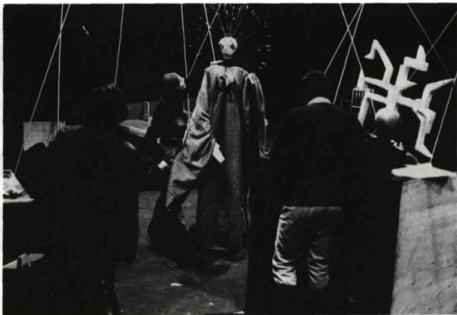
L'Araignée. Théâtre Sans Fil, 1971.

services réels gravitant autour de STAGES, de STAGIAIRES, de COURS vrais et utiles, autour aussi de notre contribution au monde énorme, riche et dynamique qu'on appelle ÉTUDIANT.