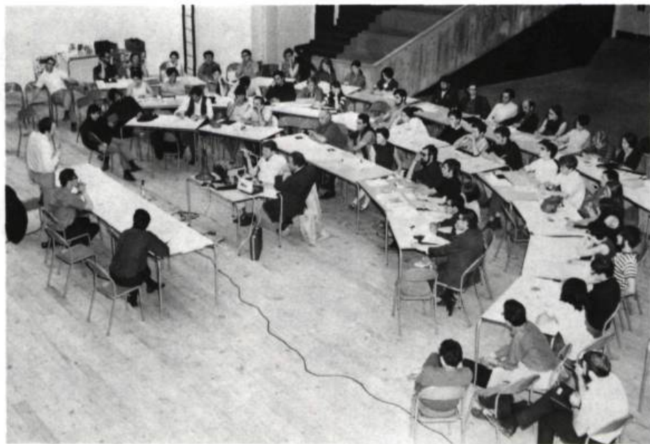
Congrès de l'A.C.T.A., début des années soixante-dix.

Que l'A.C.T.A. fasse pression auprès de la Fédération des centres culturels pour que ces derniers offrent leurs salles sur une base de pourcentage aux troupes non professionnelles de leur région.