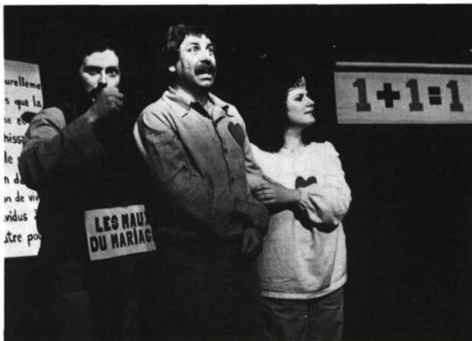
Moi, c'est moi, pis toi t'es toi, le Cent-Neuf.