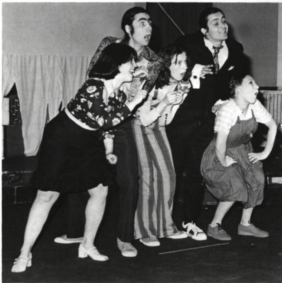
Toujours plus gros, création collective du Parminou, 1976.

14. Attendu qu'il est urgent de solutionner les problèmes de survie et de compétition entre les troupes;