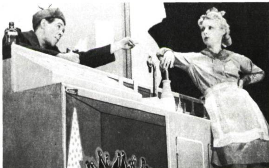
«Le Départ du conscrit» dans Fridolinons 45. Gratien Gélinas et Olivette Thibault.

dans la critique sociale inhérente à ses satires, pour laquelle il a reçu tant d'éloges; il n'est pas un réformateur. Plutôt, son génie consiste à purger par le rire une situation essentiellement désespérée: quoiqu'il décrive toutes les horreurs de l'existence avec un naturalisme sans concession, il laisse son public rire de lui-même, mais pas du tout sans avoir envie de passer outre, avec insouciance.» 10 Prisonnier d'un populisme d'une grande habileté scénique, Gélinas nous a laissé une oeuvre idéologiquement fermée sur son époque; son ouverture est ailleurs, dans l'appropriation autochtone du médium théâtral.