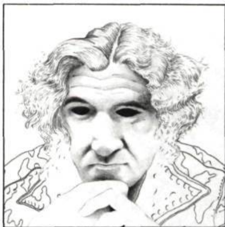
Augusto Boal