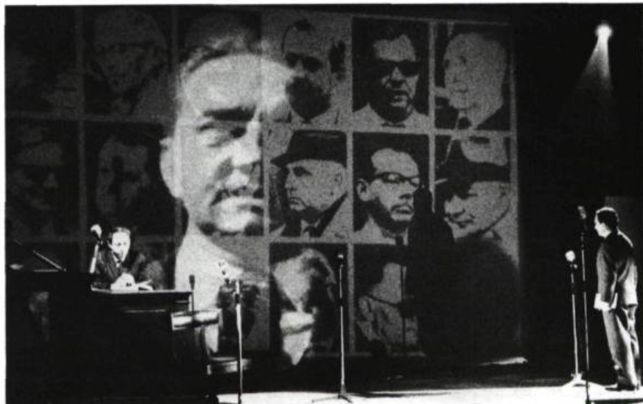
L'Instruction de Peter Weiss, mise en scène: Virginio Puecher. Dans un système très complexe mais utile, des diapositives étaient projetées pendant le spectacle. «On voyait apparaître, en superposition, l'image vidéo du témoin cherchant à reconnaître l'accusé X parmi tous ces visages.»

en préservant un équilibre constant entre la part réservée au texte et celle de l'iconographie. Certains ouvrages n'exigeraient pas autant d'illustrations. Une étude sur la perception du public n'a pas autant besoin de l'image qu'un livre consacré à l'analyse de diverses mises en scène. Nous cherchons, bien entendu, à reproduire le maximum d'éléments nécessaires, mais il faudrait éviter le superflu. Une bonne iconographie est d'abord utile. L'image n'a pas à être décorative ou illustrative. Sa place est justifiée lorsque l'image est indispensable à la clarté du texte, lorsque les rapports entre texte et images sont à la base de la compréhension de l'étude.