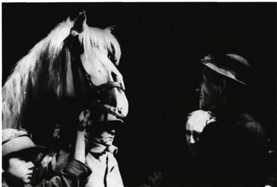
Séquence de «la Mélancolie», dans Qu'ils crèvent les artistes de Tadeusz Kantor, Nuremberg, juin 1985.