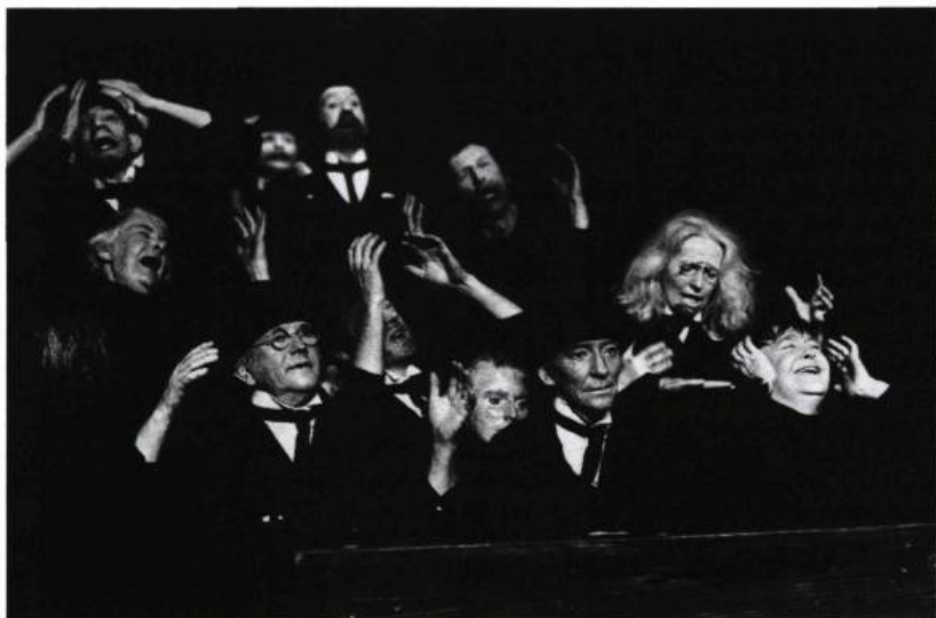
La Classe morte de Kantor, par le Théâtre Cricot 2.

D.B. — Mais il n'existe pas de point de vue commun à tous les spectateurs: l'un se trouve en haut et très loin, l'autre à gauche et en avant et un autre face à la scène! Même dans une salle frontale, à l'italienne, le point de vue du spectateur n'existe pas. Il ne faut pas embellir le spectacle, surtout pas, je suis d'accord avec vous. Mais, faisons un petit détour. La sémiologie, par exemple, a suscité de grands débats. Très utile, elle s'adapte beaucoup mieux à certains types de spectacles qu'à d'autres. La sémiologie est très discutable quand on aborde certains spectacles émotionnels ou artaudiens, alors qu'elle s'applique tout à fait à des spectacles de type brechtien. Le problème de la photo par rapport au théâtre, c'est un peu la même chose. Pour un spectacle très théâtral, la photographie doit rendre cette théâtralité, en donner une idée, ou même la renforcer pour la rendre visible. Pour un spectacle de type brechtien, la photographie doit tout donner à voir, dans les moindres détails, pour rendre compte de la technique. Il faut adapter la photographie à chaque spectacle, mais ne jamais embellir les productions.