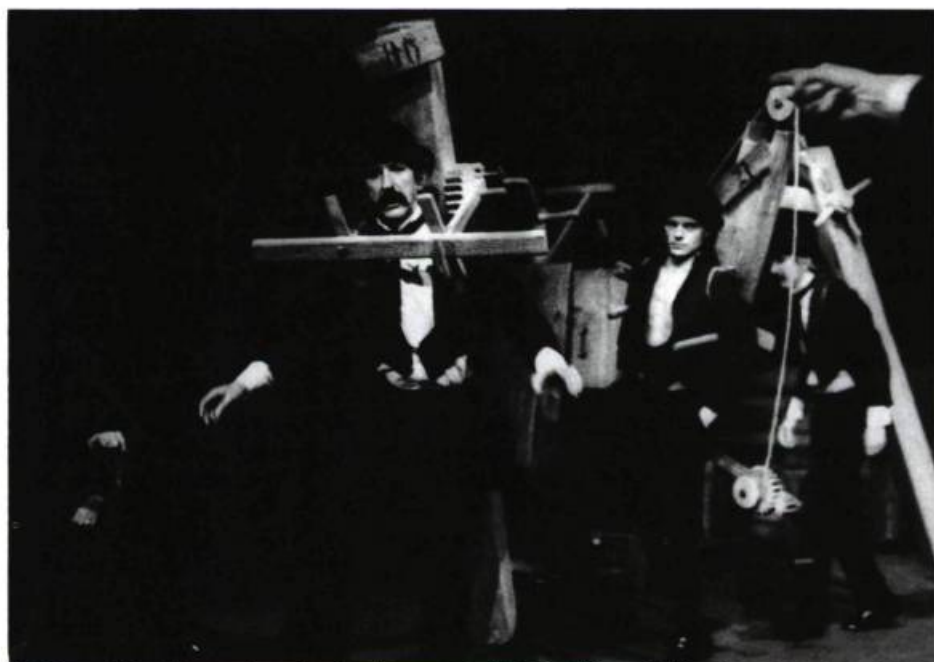
«La Danse des artistes condamnés» dans le spectacle de Tadeusz Kantor Qu'ils crèvent les artistes . Nuremberg, juin 1985.

D.B. — Pas par tous, et les choses évoluent. Au début, en 1966, les professionnels manifestaient beaucoup de méfiance, se disant que nous allions transformer leur travail, l'intellectualiser, le «théoriser», ce qui allait à l'encontre de leur démarche et de la création théâtrale, lieu par excellence de la manifestation de l'instinct, du génie créateur, de la démiurgie, etc. À l'heure actuelle, malgré certaines méfiances persistantes, la collaboration entre les artisans, les professionnels du spectacle et nous est plus étroite, de façon générale. Certains metteurs en scène craignent encore, cependant, de nous admettre aux répétitions qui constituent, à leurs yeux, un travail magique et rituel.