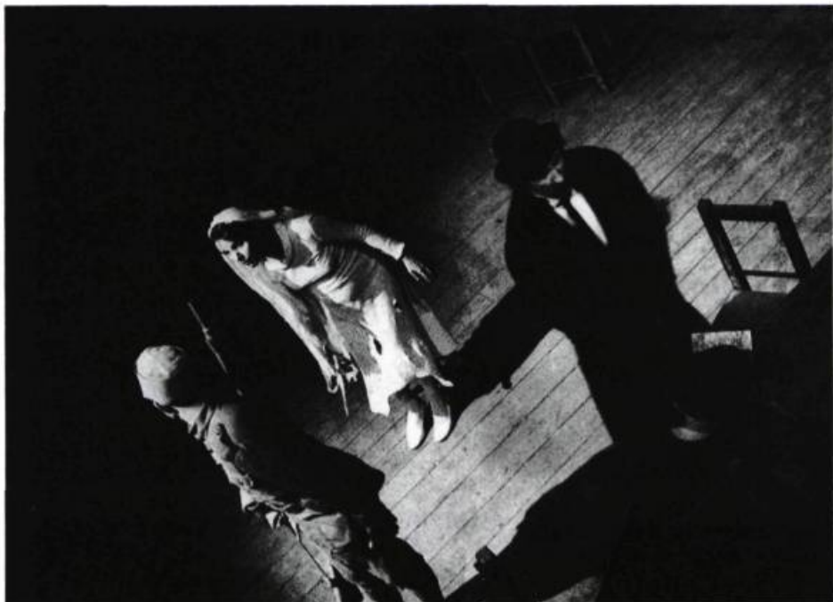
«Il nous paraît important pour la recherche de conserver le spectacle sous des angles où il n'est pas vu par le spectateur.» Wielopole Wielopole de Tadeusz Kantor, Florence, 1980.