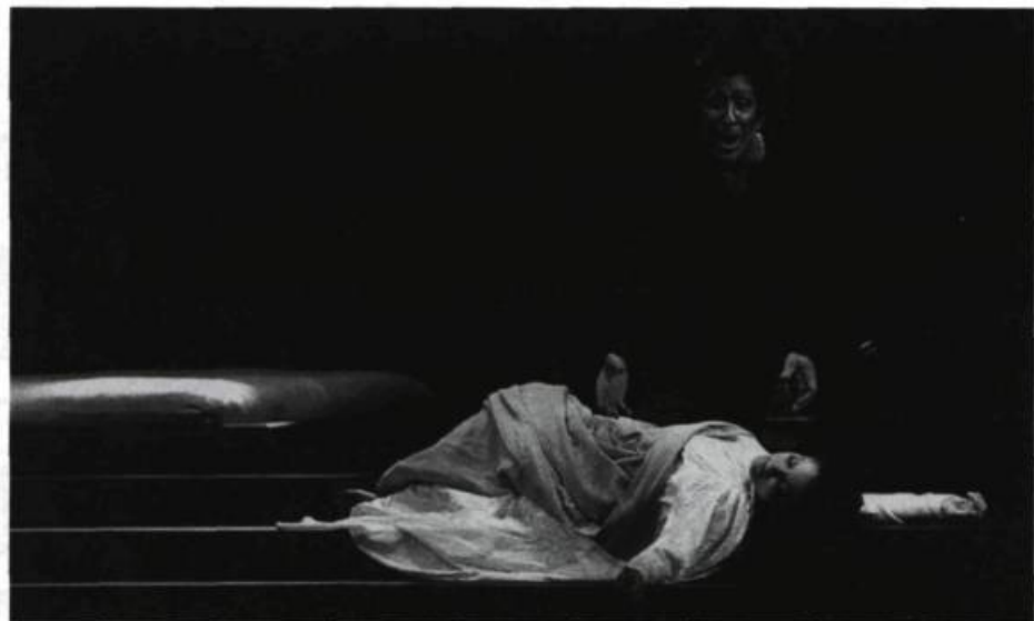
Otello de Verdi, dirigé par Antoine Vitez à l'Opéra de Montréal. «Il est intéressant de rapprocher toute tragédie de son origine, de remonter à sa source, au fait divers sordide.»

Un tel témoignage donne conscience au jeune acteur que ce que l'on joue n'est pas arbitraire. Naturellement, sous forme d'exercice, on peut s'amuser, à l'intérieur de l'école, à jouer l'interprétation la plus tragique, puis une interprétation comique, puis à voir