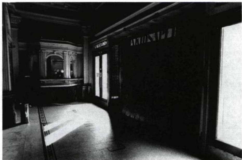
Le hall d'entrée du Théâtre Corona, construit en 1913 et décoré par Emmanuel Briffa.

C'est l'été, l'après-midi est doux et, à l'intérieur du vieux Théâtre Corona, une brise légère fait voler l'antique rideau de scène, tandis que le foyer lui-même est baigné de soleil. Sur le parterre sans sièges, étrangement vaste, des gens marchent, lèvent leurs regards jusqu'aux hauteurs vertigineuses des balcons et du toit. L'événement qui rassemble ces curieux se situe entre l'expo-