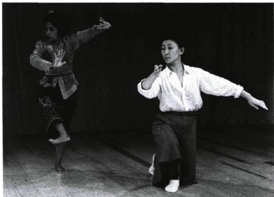
«Penser son propre théâtre dans une dimension transculturelle, dans le flux d'une «tradition des traditions»...» En septembre 1986, le congrès de l'I.S.T.A. portait sur le rôle féminin.

Pourquoi l'acteur tend-il à s'enfermer — pour chaque spectacle — dans la peau d'un seul