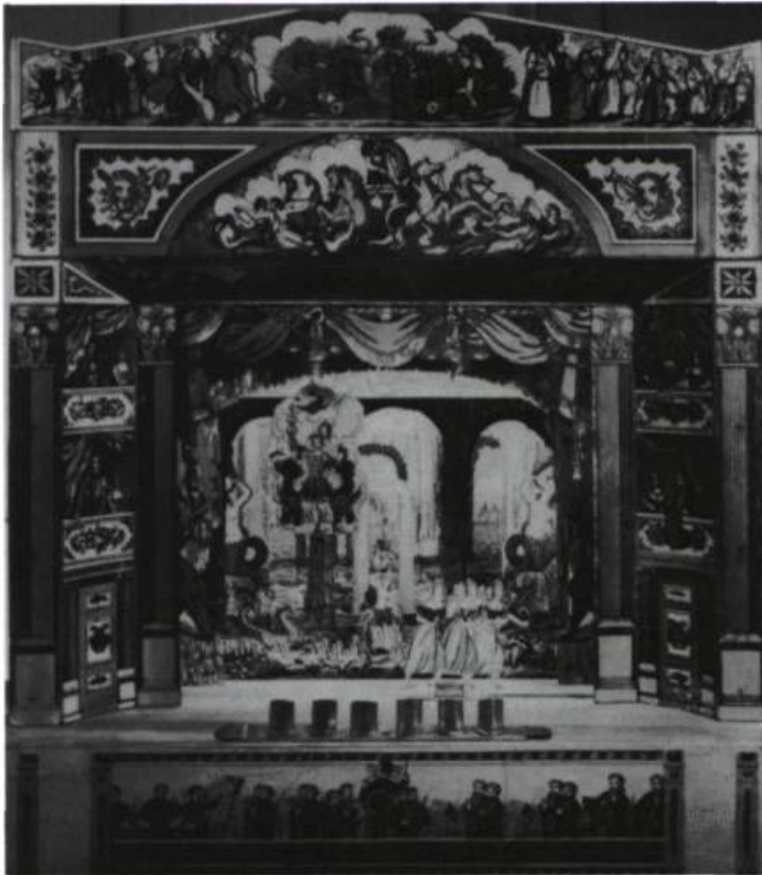
Théâtre miniature en carton, construit au XIX e siècle, en Angleterre, par Benjamin Pollock.

du public, il établit avec ce dernier de nouveaux liens, le dompte par la qualité de sa «présence» autant que par le faste de son costume; aux XVII e et XVIII e siècles, les comédiens s'habillent à même leur garde-robe personnelle, sans nul souci de vraisemblance historique: seul compte l'apparat. La voix est travaillée, l'envoûtement se raffine.