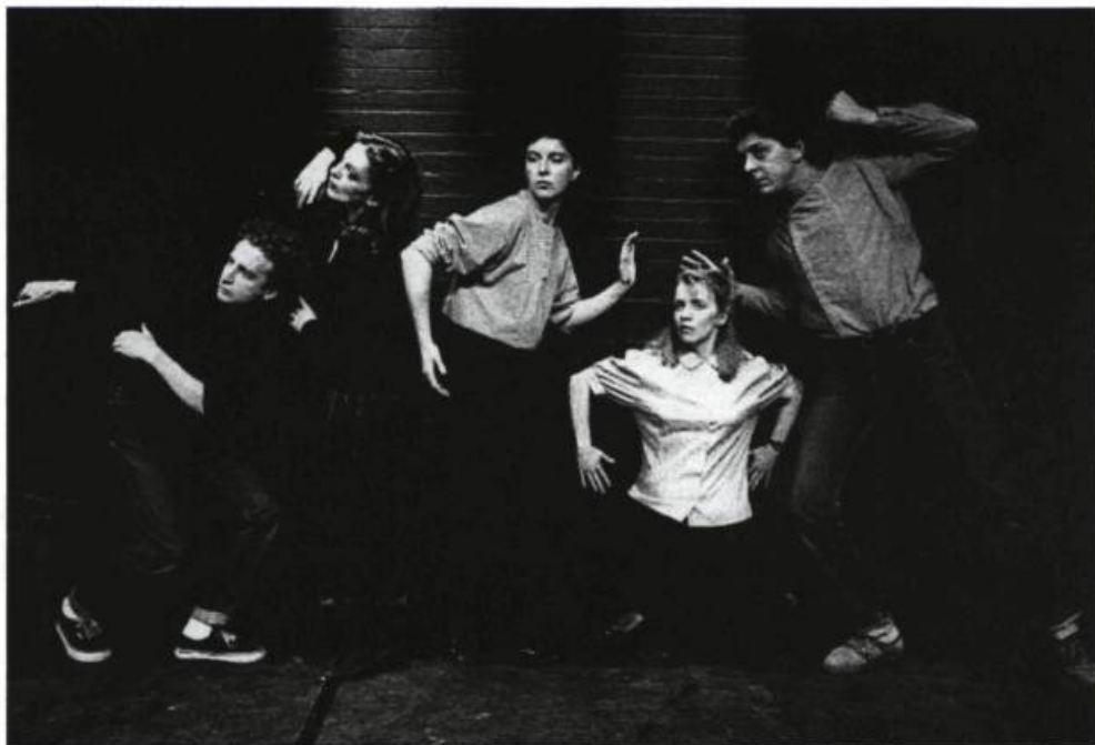
Autour de Phèdre au Nouveau Théâtre Expérimental : «Ils sont cinq à modeler leurs membres et leurs postures.»

Mais curieusement, cette idée paraît soudain déplacée, incongrue, inconvenante : une obscénité au sens premier et violent du mot. J'invoque intérieurement le metteur en scène : non, pas ça ! Qu'avons-nous à faire de ces semblants ? La mort d'Hippolyte n'a pas besoin de ces grandiloquentes échasses ! Alors, comme si cette supplique (qui était restée, inutile de le préciser, entièrement muette) avait été entendue et agréée par quelque divinité complice, le metteur en jeu hésite, tourne et retourne, songeur, la chose entre ses doigts et, finalement, se ravise : peut-être bien que la voix humaine,