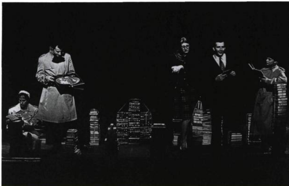
Des piles de livres évoquent des gratte-ciel newyorkais dans les Plaques tectoniques du Théâtre Repère, mis en scène par Robert Lepage à l'Implanthéâtre de Québec.

à la distance et à son abolition au sein d'un lieu plus vaste; l'espace de l'Implanthéâtre, où les spectateurs sont installés sur deux niveaux tout autour de l'aire de jeu, évoquait au contraire un univers clos où les déplacements sont restreints.