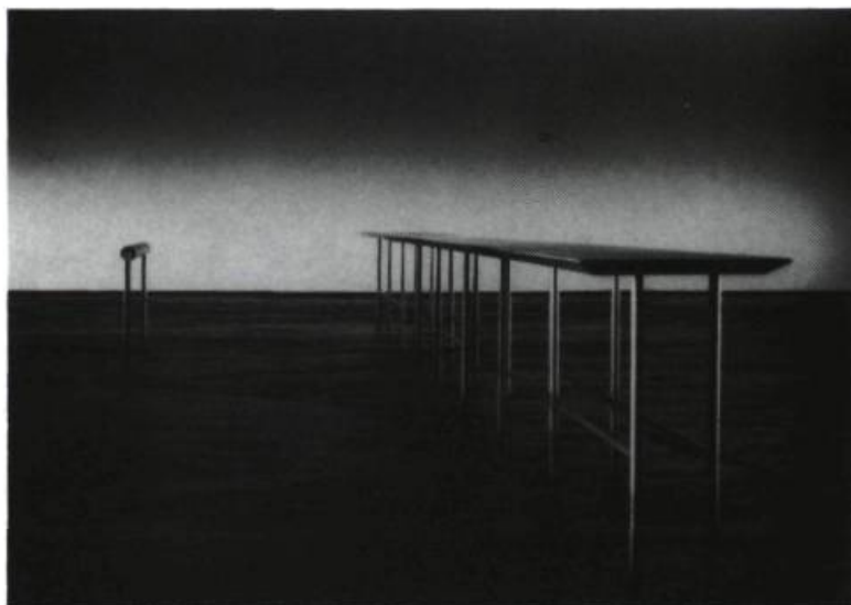
Décor de Robert Wilson pour la scène 6.

Par l'utilisation royale de la meilleure technologie scénique qui soit, il sait donner à l'espace et à la lumière qui s'y meut une autonomie souveraine. Ses dessins préparatoires 12 (selon moi fortement influencés par l'œuvre d'E.G. Craig) montrent toujours le plateau vide, sans silhouette humaine. Cette curieuse désertion de l'acteur donne aux images un caractère irréel, abstrait, une géométrie qui pourrait être aussi bien microscopique que macroscopique. Parfois un élément isolé — ruine du