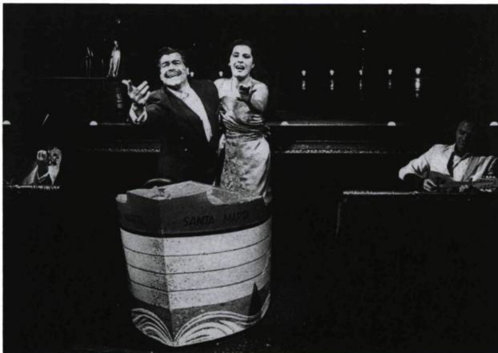
«Marta [...] se précipitera dans une barque placée dans la fosse d'orchestre où l'attend Mariano.»

Sur ce fond quasi aérien et quelque peu idyllique surviendra le «drame», celui de la disparition de Marta, d'abord présenté et ressenti comme un amusement, comme un simple divertissement aux dépens d'un mari trop jaloux et trop possessif. C'est ce que la mise en scène de Strehler met bien en valeur par le contraste des styles entre la légèreté sérieuse de ces vacanciers en mal de divertissement et la théâtralité volontairement kitsch de la séance de magie au cours de laquelle Otto Marvuglia, illusionniste sans grand art, fera disparaître Marta en dévoilant, pour le public que nous sommes, les ruses de son métier : Zaira ouvrira une porte secrète cachée à l'arrière du sarcophage et située face au public pour en faire sortir Marta, qui se précipitera dans une barque placée dans la fosse d'orchestre où l'attend Mariano. Les deux amants quitteront la scène sous une pluie de confettis en passant dans la salle, bercés par les sérénades des musiciens sortis de la fosse d'orchestre.