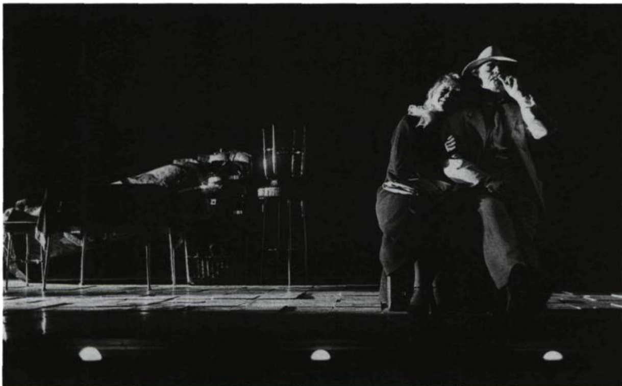
La Grande Magia d'Eduardo de Filippo. «Les rayons du soleil couchant baignaient la scène dans une lumière rasante aux tons chauds.»