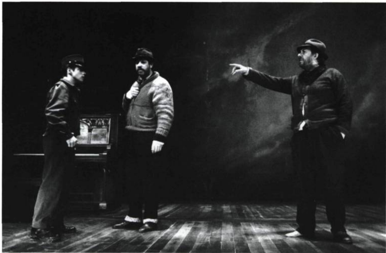
En attendant Godot, Théâtre du Nouveau Monde (janvier 1992).