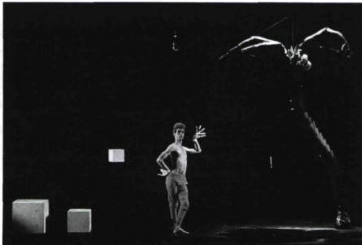
Acte sans parole I, Troupe Cité (1984).