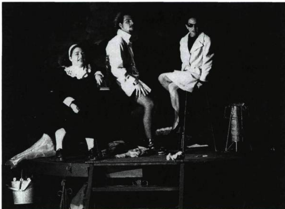
Macbeth , les Têtes Heureuses, 1993.

séduisante entité au service de l'horreur de l'anecdote. Tout s'organise ainsi de façon à concrétiser le cauchemar d'un fantôme.