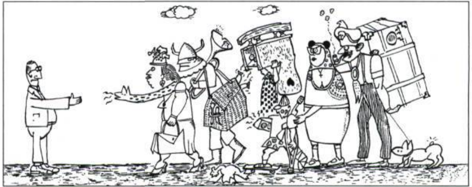
Dessin de Jean-Pierre Langlais.