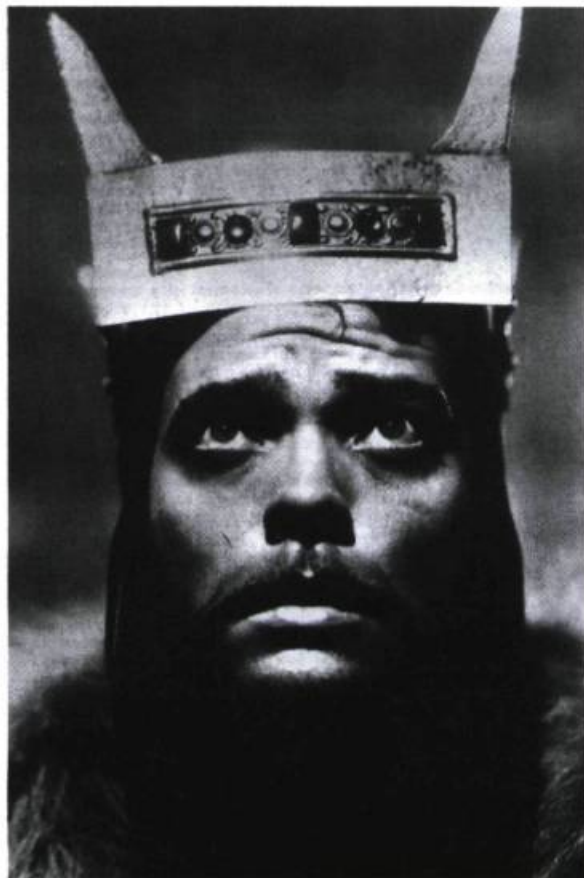
Un acteur qui n'a pas froid aux yeux : Orson Welles dans Macbeth , film qu'il réalisa en 1948.