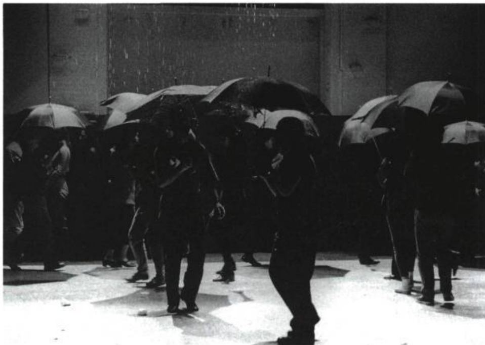
« La pluie ».