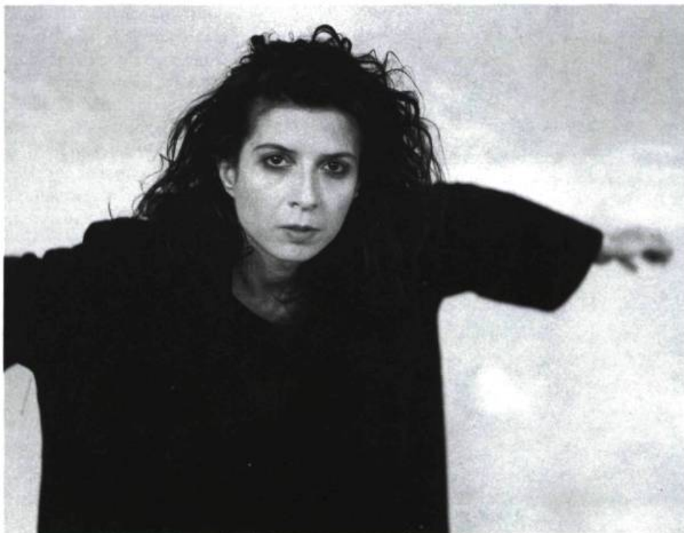
Absolut , 1990.

Montréal où j'ai fait un baccalauréat en anthropologie, mais, en dépit de mon engagement dans ces études, je sentais que c'était la danse qui m'attirait profondément.