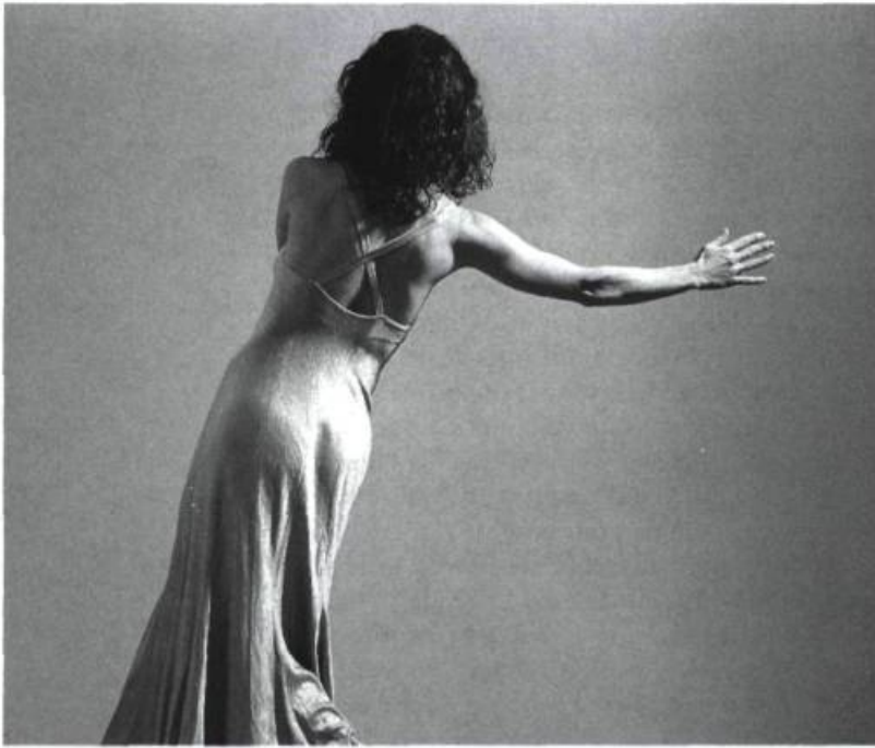
Les Choses dernières , 1995.

Quelle a été votre source d'inspiration pour les Choses dernières ?