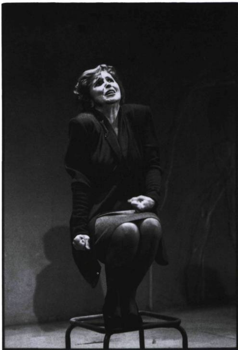
Martha (Hélène Loiselle) dans Leçon d'anatomie , (Théâtre d'Aujourd'hui, 1992)