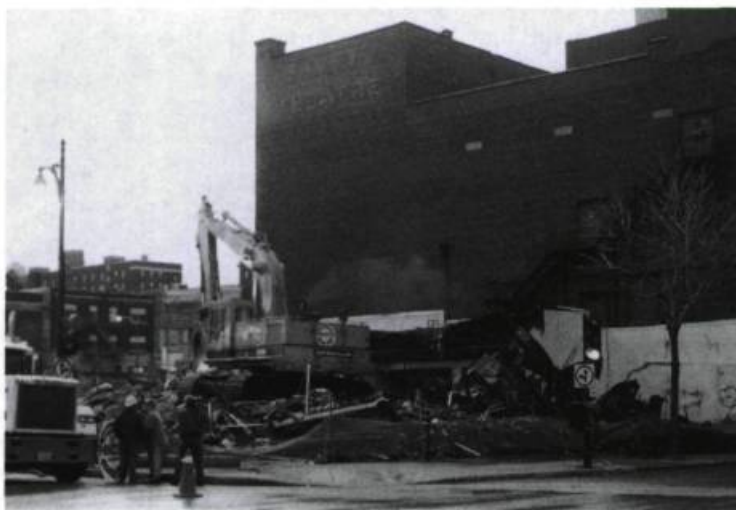
La démolition de l'entrée du TNM s'est faite au petit matin, le 2 mai 1996.

Il faut préserver l'architecture de la salle. Nous avons découvert des détails de l'ornementation sur des photographies qui sont à la Bibliothèque nationale. Le cadre de