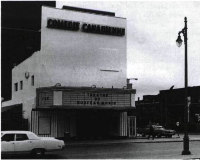
La Comédie-Canadienne est acquise par le Théâtre du Nouveau Monde en 1972.

Luc P. – Nous, nous fournissons les composantes, et c'est l'architecte qui fait battre le cœur de l'édifice. De notre côté, nous sommes toujours très fonctionnels, car nous jonglons avec des normes scénographiques et techniques à respecter. Nous sommes même souvent des rabat-joie... mais cela ne doit pas empêcher le lieu d'être inspirant déjà de la rue. Seul un architecte d'une grande sensibilité peut donner une âme à un théâtre.