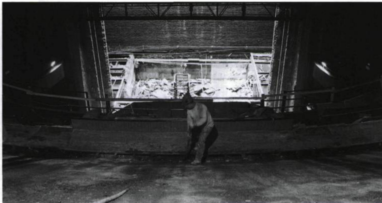
Travaux effectués au « poulailler » du TNM, en mai 1996.