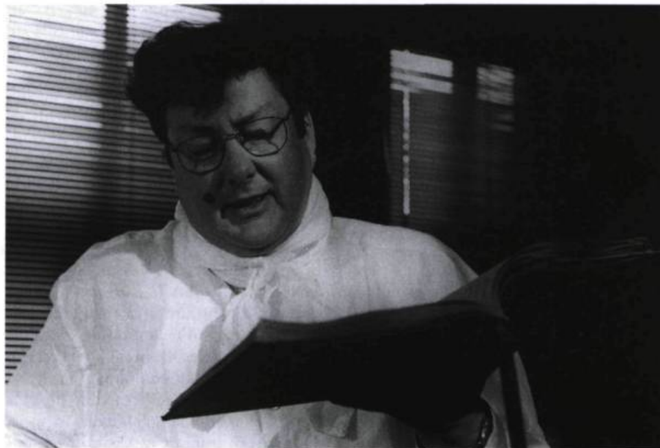
Matines : Sade au petit déjeuner (NTE, 1996).