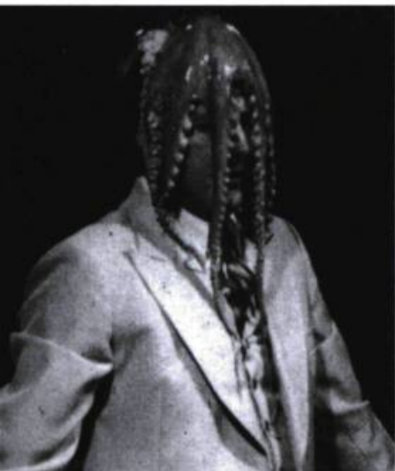
Sous le poule dans Treize Tableaux (NTE, 1980).