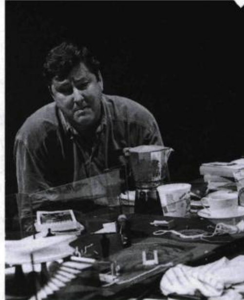
Tête à tête, spectacle de Robert Gravel et de Jean-Pierre Ronfard (NTE, 1994).