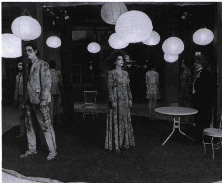
Garden Party (TEM, 1976).