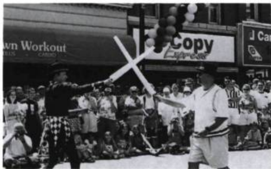
L'Homme-papillon : un souvenir amer...

Aucun doute ici. L'Homme-papillon qui, pour le dire avec Bakhtine, fait de son public l'objet de sa raillerie, ne suscite pas un « rire ambivalent », c'est-à-dire à la fois « joyeux, débordant d'allégresse » et « sarcastique ». Suis-je puriste ou puritaine quand je m'offusque de la façon que les enfants, qui composent pour une grande partie le public de tels festivals, sont interpellés dans ce spectacle ? La plupart des artistes se sont amusés de l'émerveillement ou de la candeur des enfants (souvent pris comme volontaires), mais toujours l'ironie ou le sarcasme semblait participer de la fête populaire. À l'Homme-papillon qui apostrophe un enfant pour se moquer de son costume (« Ta mère devrait t'empêcher de t'habiller comme cela ; tu feras rire de toi à l'école ! »), s'oppose la complicité joyeuse du New-Yorkais Hilby avec un enfant de quatre ans à qui il demande littéralement de lui sauter dans les bras et qui finira par le porter sur ses épaules dans un numéro d'unicycle particulièrement réussi. Les dif-