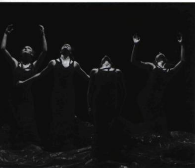
Le Funambule , une chorégraphie de Ginette Laurin présentée par les Grands Ballets Canadiens.

Bien que très jolie, cette pièce un peu répétitive n'a pas tout à fait atteint le degré d'émotion que les drapés dramatiques, rouges, jetés au sol, laissent planer. On sent