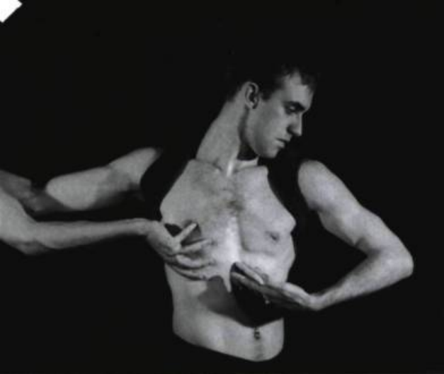
Fugitives Épiphanies d'Irène Stamou, à l'Agora de la danse.

écouter. Éric a emprunté le style de son costume à son père, Julien à sa mère, Jean à ses rêves d'enfant. C'est du moins ce qu'ils nous ont raconté, après leur prestation purement physique. La conclusion de l'expérience revient à Catherine Tardif : « Le fait de chercher la porte d'entrée crée le spectacle. »