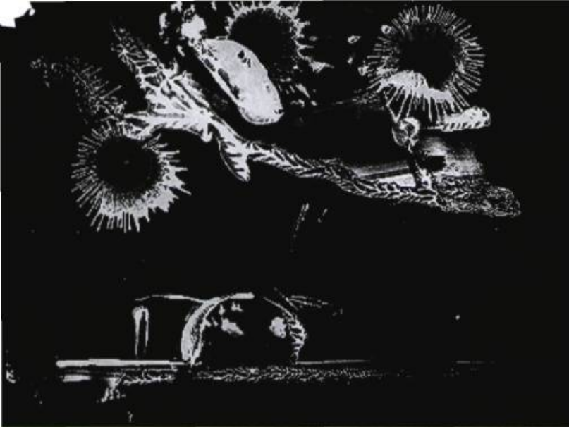
Peinture de Serge Ouaknine pour Feu d'artifice n° 1 , parc de la Villette (Paris) en 1992.

à celle de la parole mais échappe à la logique de l'intellect, qui conserve l'immédiateté de la pulsion, précède le sens et transcende, en fait, la parole. Avec le temps, il a pu diriger des acteurs du Théâtre Laboratoire dans des exercices sur le Balcon de Jean Genet où le dessin ne rendait plus compte du travail d'un autre, mais servait sa propre démarche. Le dessin est devenu un outil de travail qui accompagne la mise en scène et la pédagogie de l'acteur.