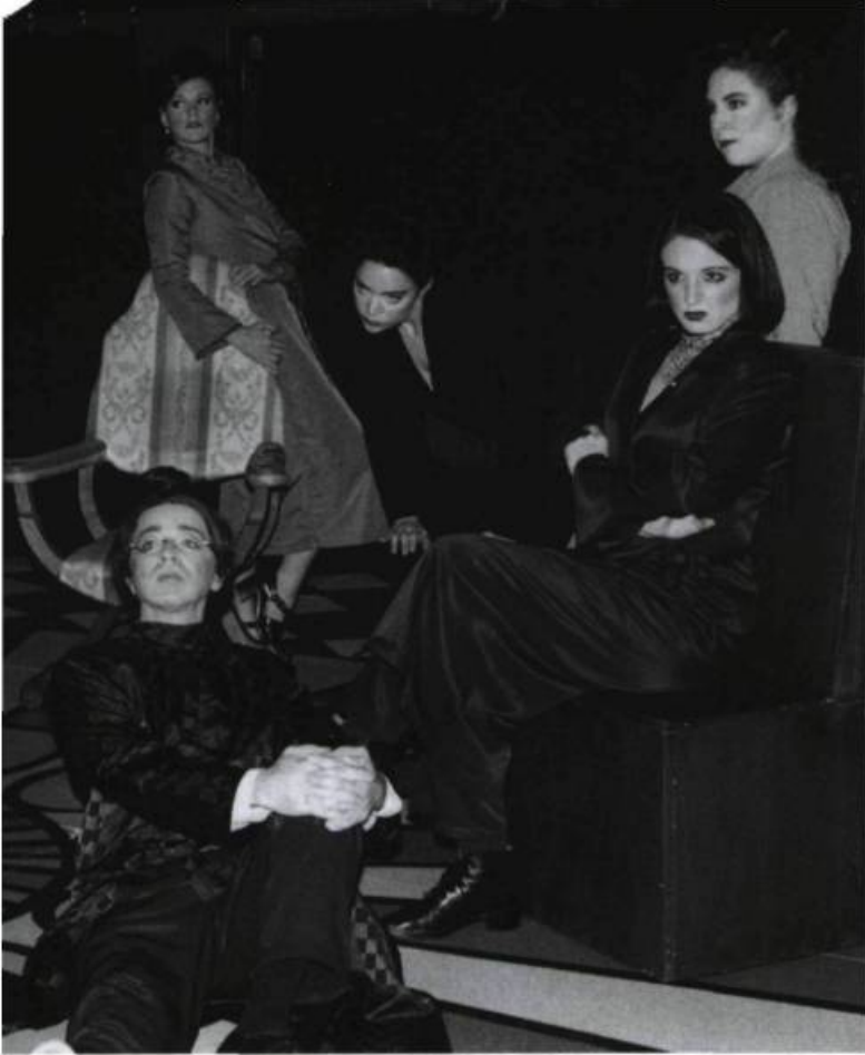
Richard moins III , Théâtre Kafala, 1998.

ancêtres Juliette Dubourgue et Kevin O'Brien, apparus après la séance de psychométrie, raniment de vieilles querelles politiques et sociales. Aussi, la mort, omniprésente dans la famille, est peut-être liée à un mystérieux lit qui appartient au patrimoine familial.