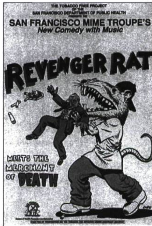
Affiche de Spain Rodriguez, tirée de Contaminating Theatre .