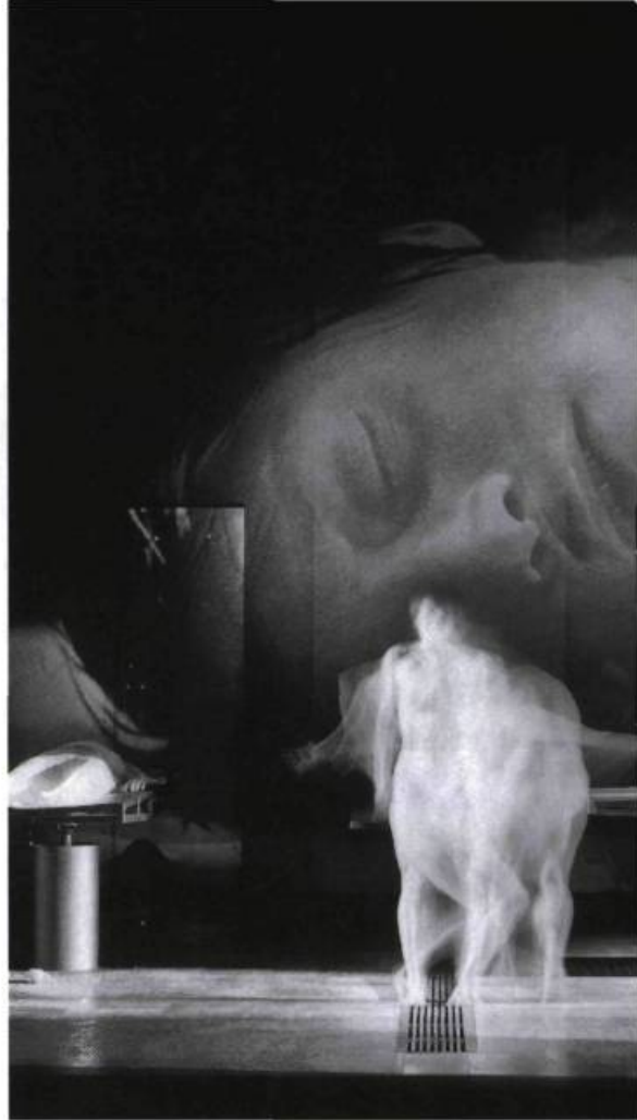
Stabat Mater II de Normand Chauréte. Théâtre du Nouveau Monde, 1999.

La scénographie de Danièle Lévesque est pourtant juste et intéressante : son immense décor gris et noir a la froideur hygiénique des salles d'opération et des salles d'attente.