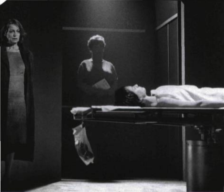
Stabat Mater II de Normand Chaurette, mis en scène par Lorraine Pintal. Théâtre du Nouveau Monde, 1999.