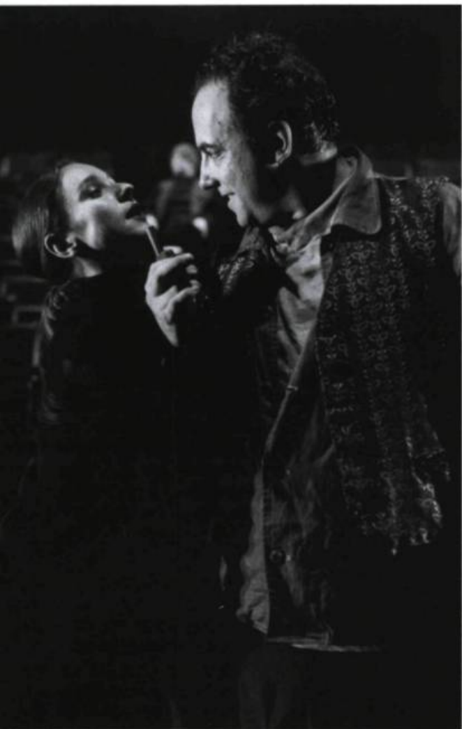
Figure solidaire de l'enfermement et de l'impuissance, le thème du labyrinthe s'avère un fil d'Ariane qui mène loin chez Tchekhov. La dernière scène de la Cerisaie est, à

cet égard, emblématique. Le vieux Firs, sourd, gâteux et agonisant, est oublié de ses maîtres qu'il a fidèlement servis toute sa vie, dans une maison dont toutes les issues ont été condamnées par eux à leur départ, toutes les portes fermées à clé. Il a été oublié tout comme, « dans le temps », la recette de la cerise qui, bien que séchée, restait « douce, juteuse, sucrée, parfumée... ». Maintenant, dans le vestibule aux nombreuses portes, au cœur du labyrinthe de pièces nues, le voici qui trône dans la demeure désertée, close comme un tombeau, Minotaure pathétique et risible issu d'innombrables générations de serfs, voué à une mort qui ne semble plus vouloir de lui. Il sait qu'il ne s'en sortira plus et n'essaye même pas d'ailleurs de réagir. Son dernier mot – qui est donc celui de tout le théâtre de Tchekhov – sera pour s'accabler : « Va... espèce d'empoté... »