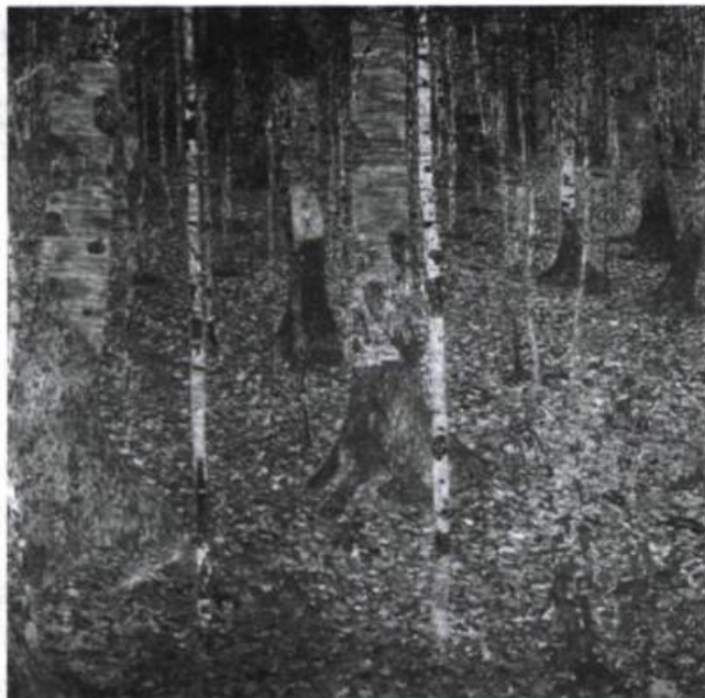
Gustav Klimt, Forêt de bouleaux , 1903.

Comme pour toutes ses autres pièces, Tchekhov a assigné un lieu précis pour chacun des quatre actes d' Oncle Vania . D'abord un jardin, puis, successivement, une salle à manger, un salon et une grande pièce dans la maison de Sérébriakov (en fait, c'est la maison que sa défunte première femme, la sœur de Vania, avait reçue en dot de son père). Cette répartition des lieux n'a rien de bien surprenant. Elle se conforme à la règle assez fixe d'alternance entre le dedans et le dehors, la maison familiale et les espaces verts qui l'abritent, coutumière à Tchekhov. Cette prédilection pour de vastes