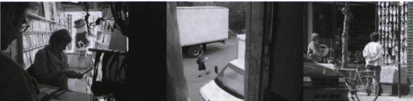
Coincidence d'un potentiel infini , parcours proposé par Farine Orpheline dans le quartier Hochelaga-Maisonneuve lors du FTA 2003.

La compagnie Farine Orpheline cherche ailleurs meilleur, qui s'est fait une mission d'investir des lieux à moitié abandonnés ou en voie de transformation (un hôpital psychiatrique 4 , une vieille usine, une ancienne minoterie), s'inscrit très concrètement dans le tissu urbain pour élaborer chacune de ses interventions. Présentée dans le volet « Nouvelle Scène » du 10 e Festival de théâtre des Amériques, en mai 2003,