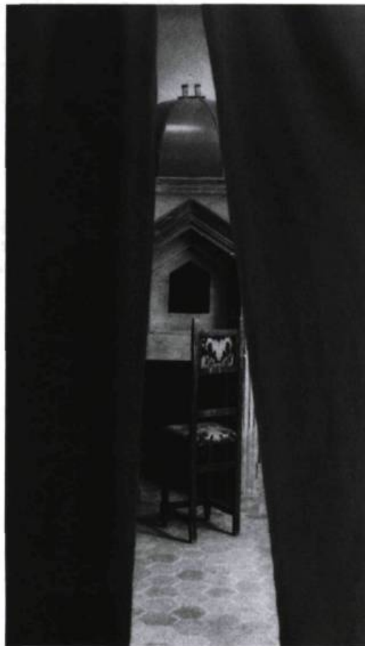
La Méridienne d'Ézéchiél Garcia-Romeu. Spectacle du Théâtre de la Massue (France), présenté au Carrefour 2002.