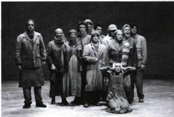
e. Roman-dit de Daniel Danis, mis en scène par Alain Françon. Spectacle du Théâtre National de la Colline, présenté au FTA 2005.

L'onirique tient de l'imagerie, à laquelle on accole des images du vrai quotidien – de la vie réelle. Si l'on y ajoute des expériences de l'ordre de la sensation, cette zone s'appellerait l'imagique. Et le rêvique est à côté. Dans les trois cas, et même dans le sphérique, le temps se joue. L'aspect de l'historique est joué dans le sphérique, la connaissance du vocabulaire, la langue, et ainsi de suite. Les trois ensemble constituent un voyage du corps mental, mais aussi du corps réel, où l'on vit une vraie sensation. Autant le corps imagique ou rêvique que la fonction sphérique de la langue accaparent tout cela pour s'aplatir en deux dimensions et donner de vraies lignes de texte. Le rythme tient aux résidus de l'expérience qui tombent sur la page. Pour moi, la guerre est un vecteur comme l'eau, qui est présente aussi dans plusieurs de mes pièces. Il y a aussi, par exemple, des fusils ou des seringues. Ainsi, la nuit dernière, j'ai vu des militaires tuer un jeune garçon. Cela a peut-être des liens avec les pillards de la Nouvelle-Orléans... Mais ce jeune homme ne voulait pas être tué par des militaires,