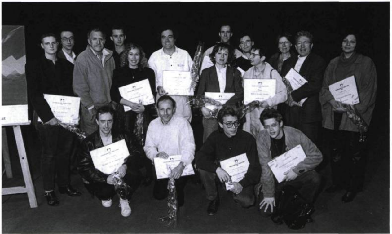
L'attribution des Prix de la critique constitue l'activité principale de l'AQCT. Les lauréats des prix 1989-1990.

d'un vote des membres, alors que les spectacles gagnants sont désignés au terme d'une discussion souvent mouvementée.